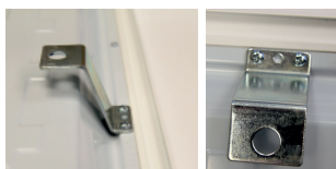
89-1029 Winkel/Befestigung am Panel für Seilabhängung