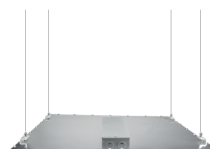
Gesamteindruck Abbildung ähnlich. (beispielhaft)