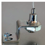
81-2101 Montage an 89-1029 (beispielhaft)