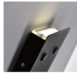
Detailansicht UP-Light (indirekt)