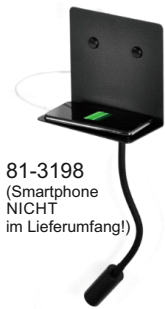
81-3198 (Smartphone NICHT im Lieferumfang!)

Artikel-Nr.: 81-3198 (schwarz) / 81-3199 (weiß)